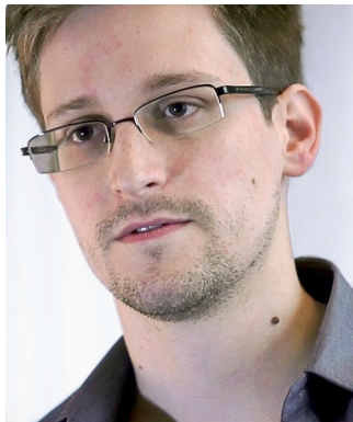
Laura Poitras / Praxis Films CC-BY-SA 3.0